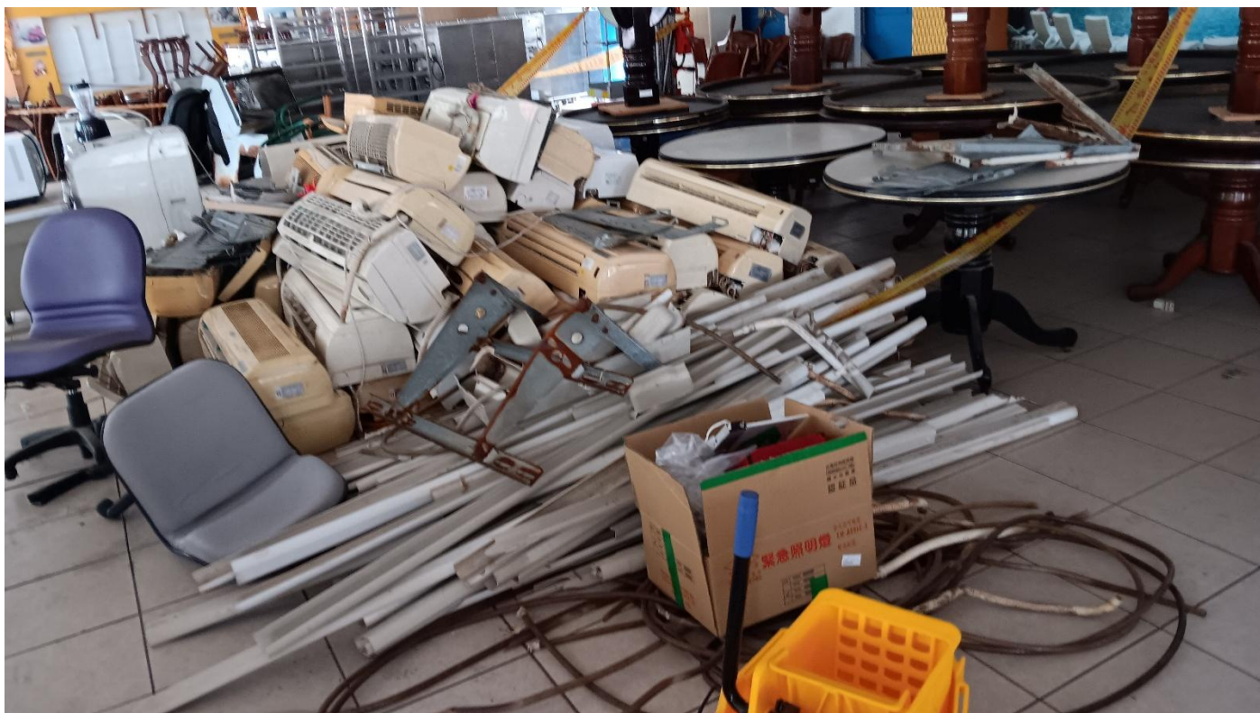
以上廢品不含木桌木椅