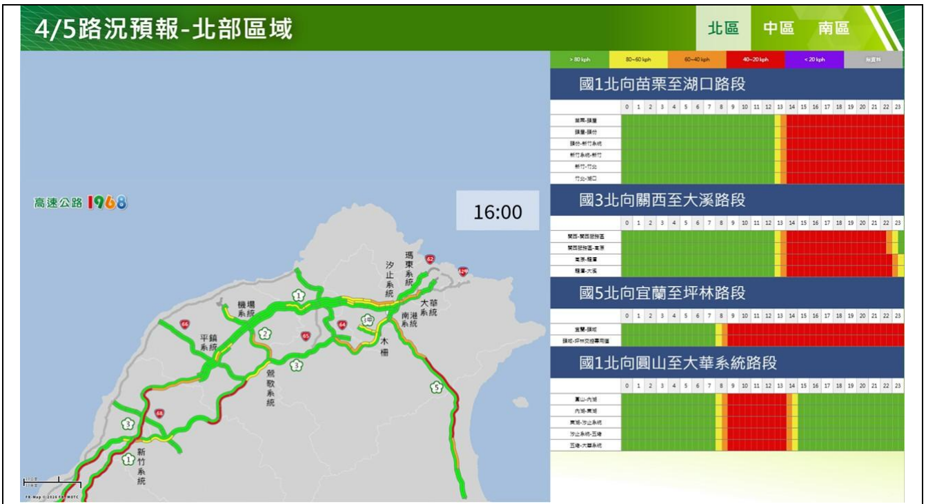
清明節連假收第3日路況預報圖(北區)