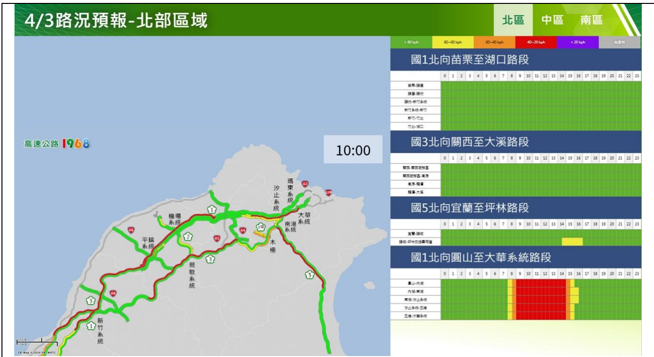
清明節連假第 1 日路況預報圖(北區北向)