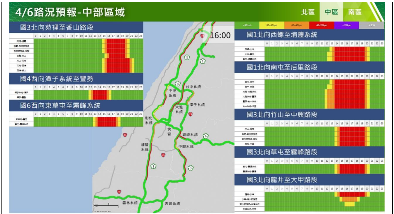
清明節連假第3日路況預報圖(中區)