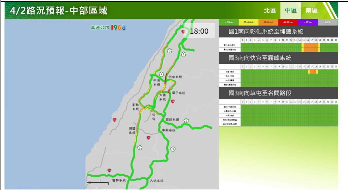
清明節連假前 1 日(上班日)路況預報圖(中區)