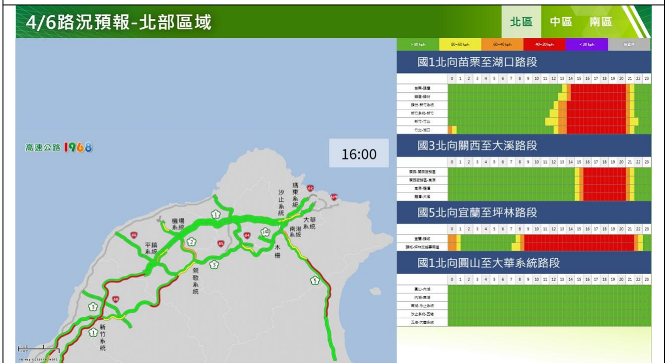
清明節連假收第4日路況預報圖(北區)