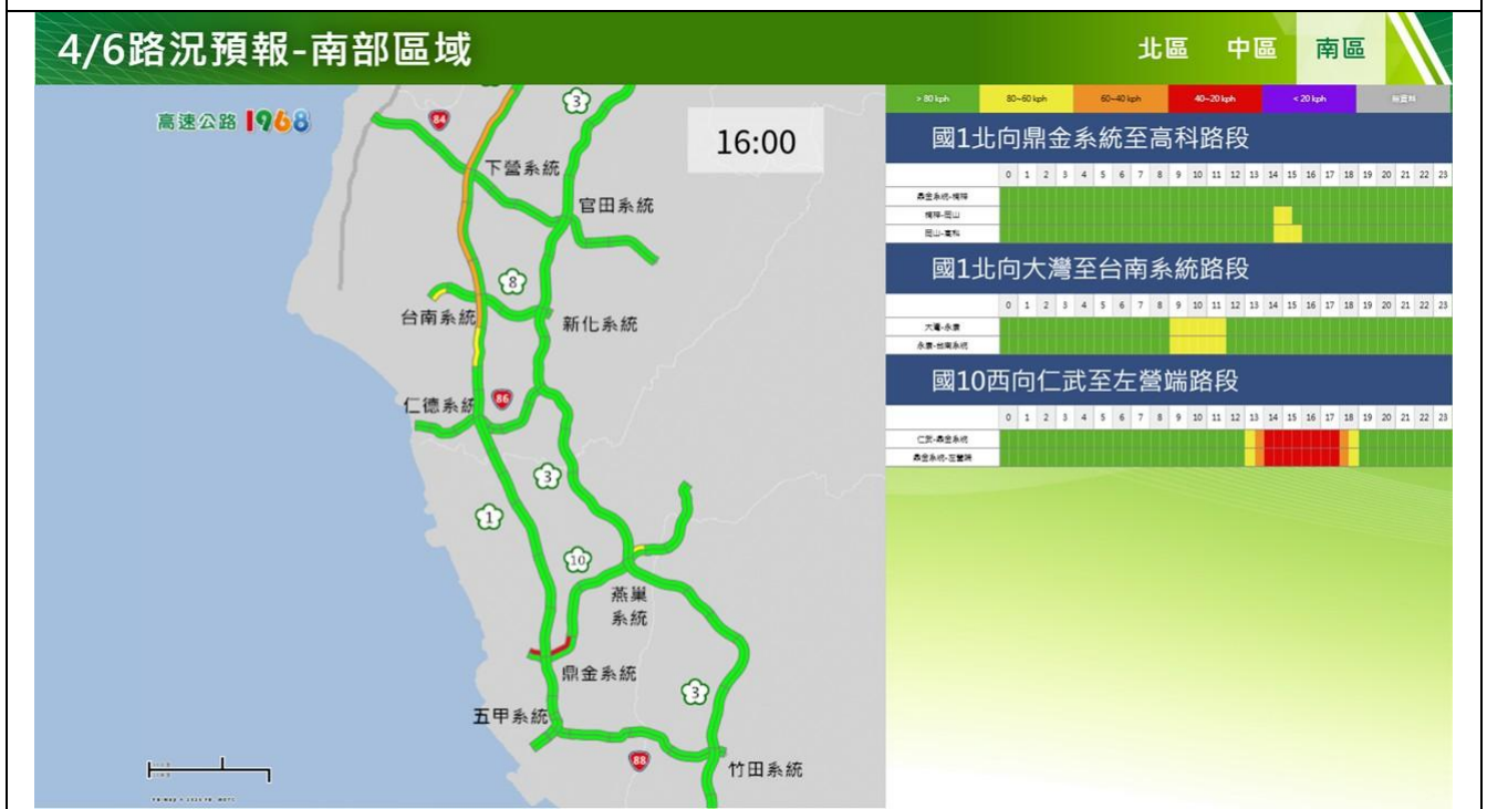
清明節連假第3日路況預報圖(南區)