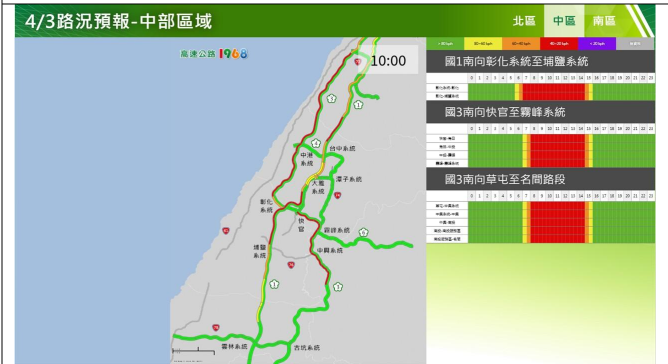
清明節連假第 1 日路況預報圖(中區)