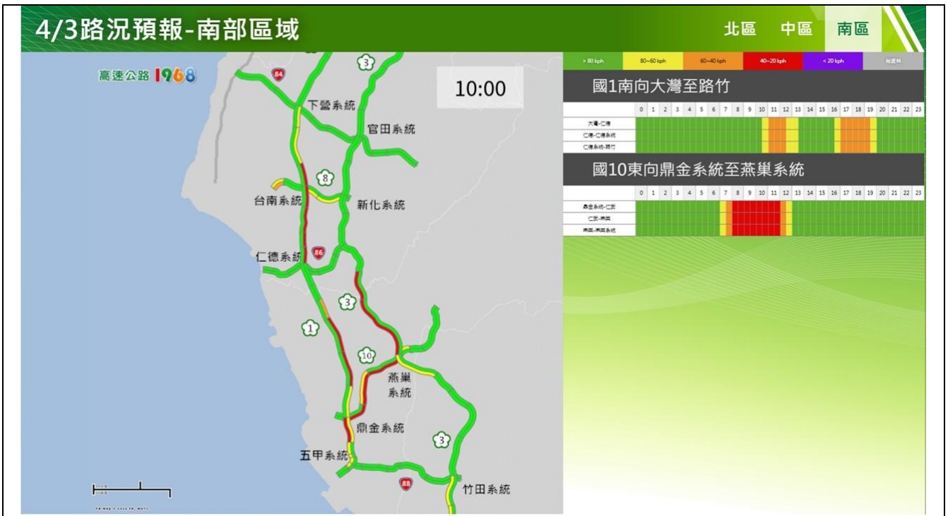
清明節連假第 1 日路況預報圖(南區)