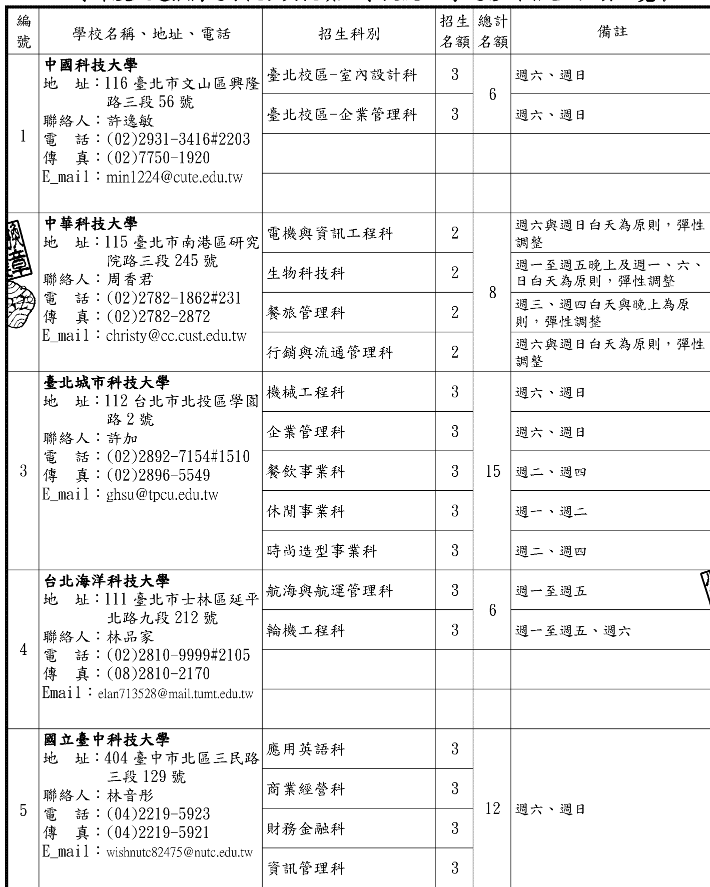
115 學年度甄選推薦退除役官兵就讀大專校院二專進修部招生名額一覽表