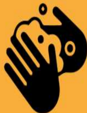
加強個人衛生防護