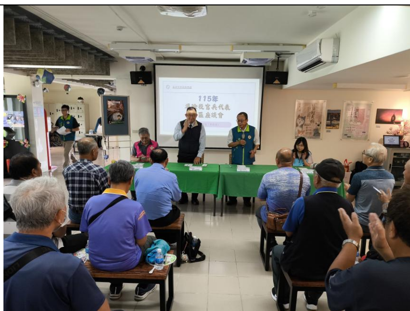
高國書場長答覆榮民提問