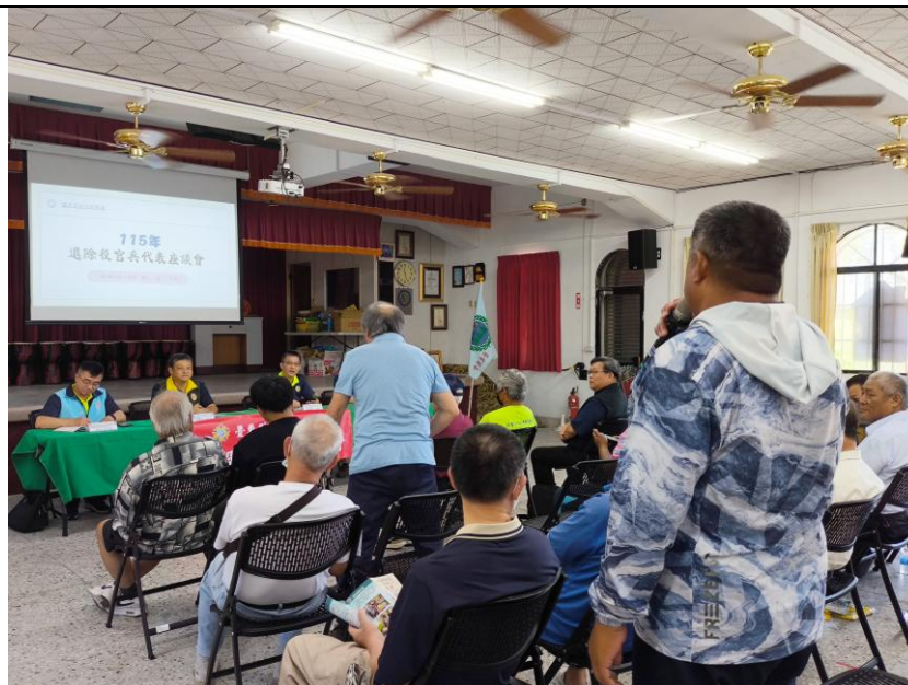
與會榮民發表意見