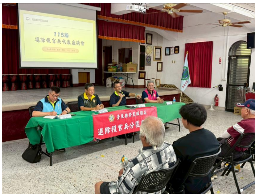
榮家、榮院、農場代表一同出席