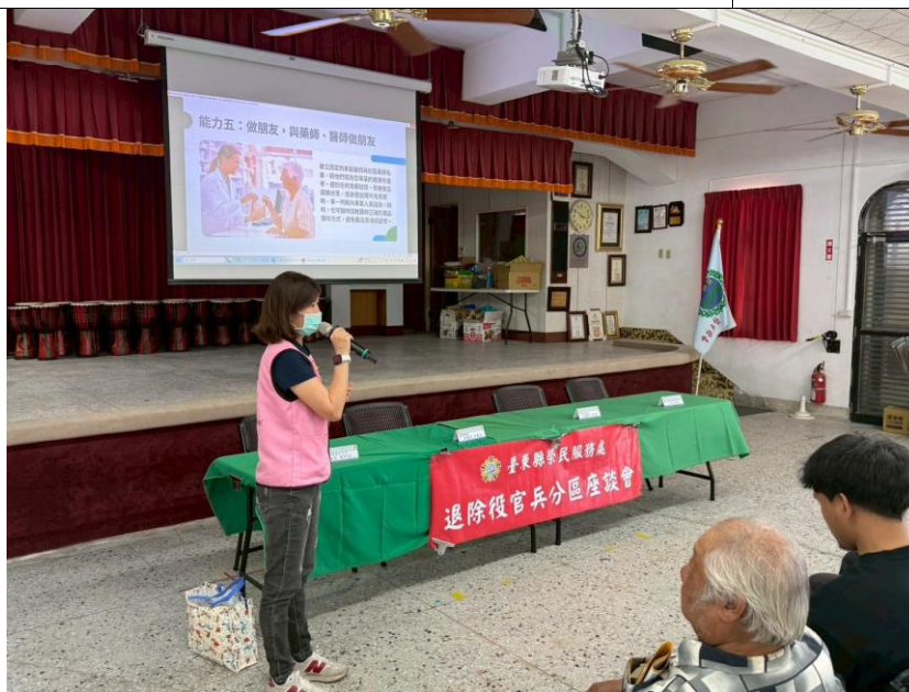
邀請關山衛生所辦理用藥與健康講座