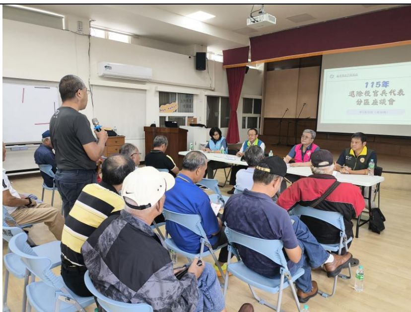
與會榮民提出建言