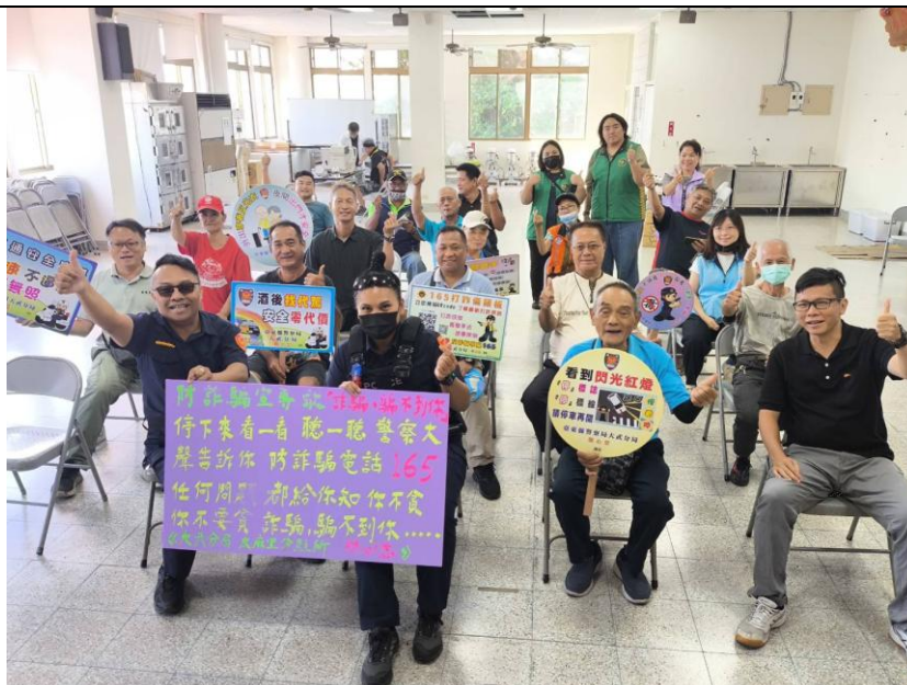
邀請警察局、鄉公所宣導反詐騙與國民年金等權益。