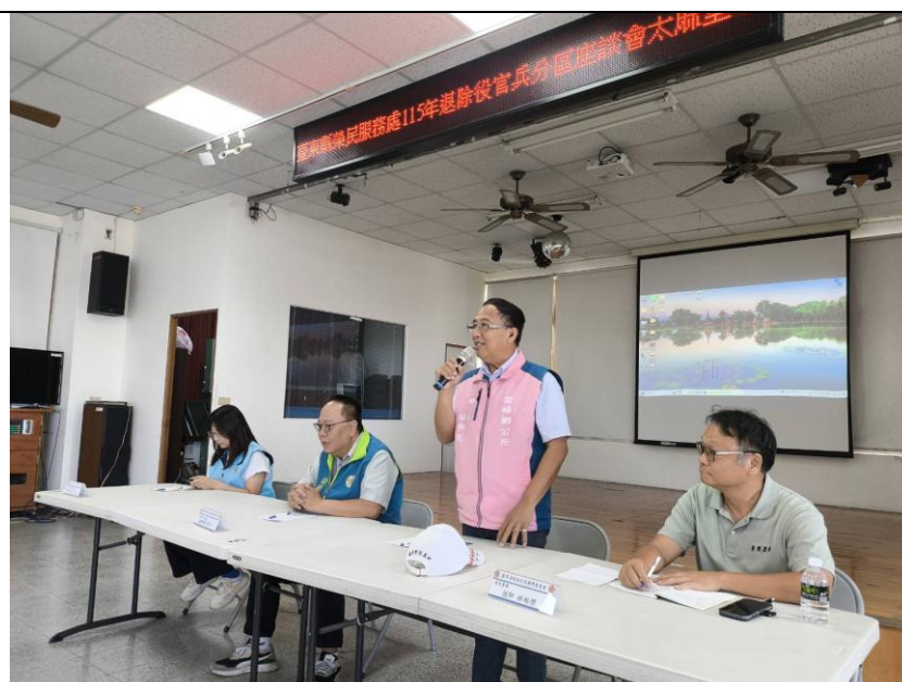
金峰鄉長列席，一同聽取榮民意見