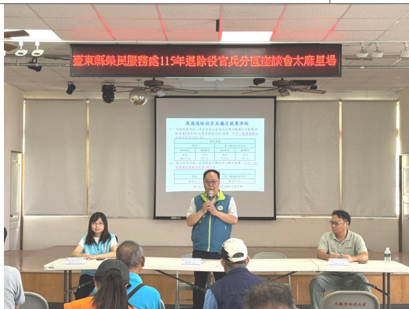
曾中一總幹事主太麻里、達仁、金峰地區分區座談會